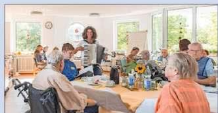
Helle Räume laden jetzt zum Verweilen in geselliger Runde ein.

Helle, freundliche Räume laden jetzt zum Verweilen in gesell-